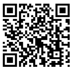
「全民健保行動快易通」 APP 操作步驟說明