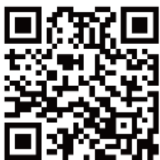
「全民健保行動快易通」 iOS 及 Android 通用版下載