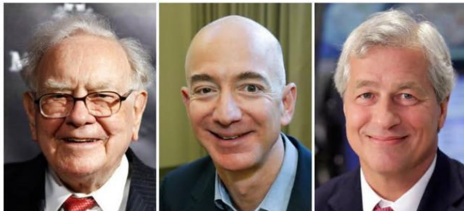
From left: Warren E. Buffett of Berkshire Hathaway, Jeff Bezos of Amazon and Jamie Dimon of JPMorgan Chase.

Employees at an Amazon warehouse in Florence, N.J. The company will join forces with Berkshire Hathaway and JPMorgan Chase to try to improve health care.